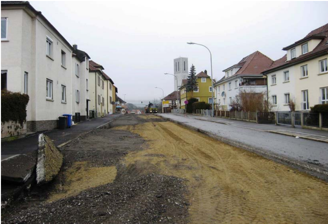
Fräsarbeiten Januar 2008