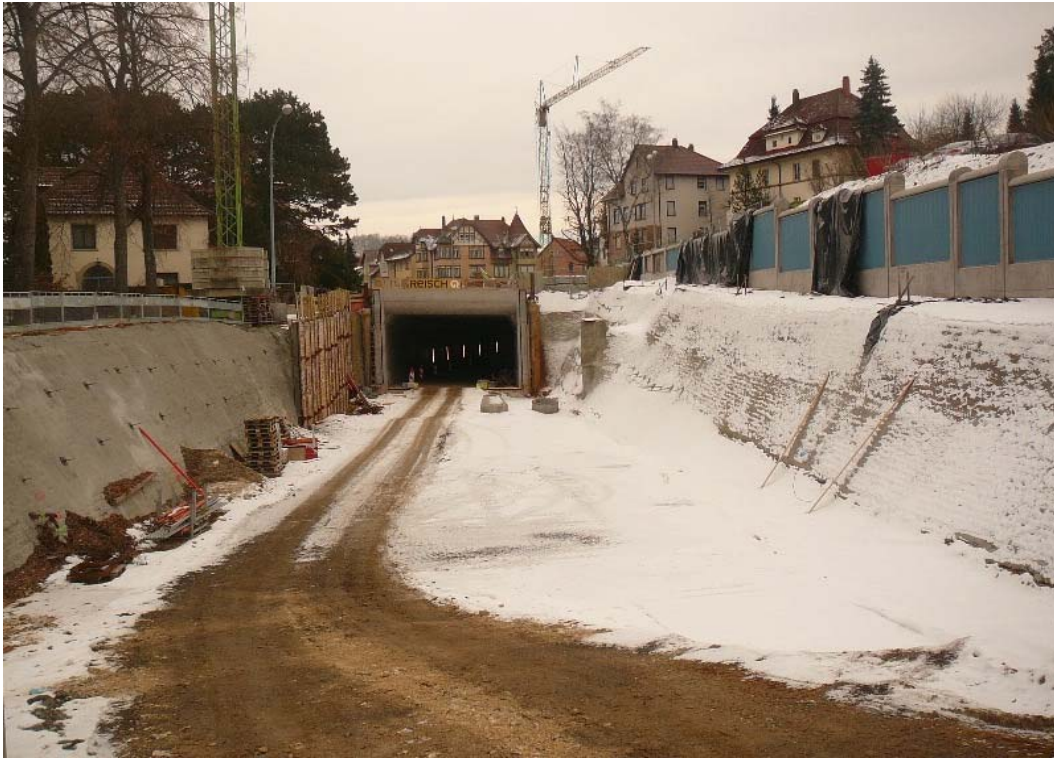
Portal West Februar 2009