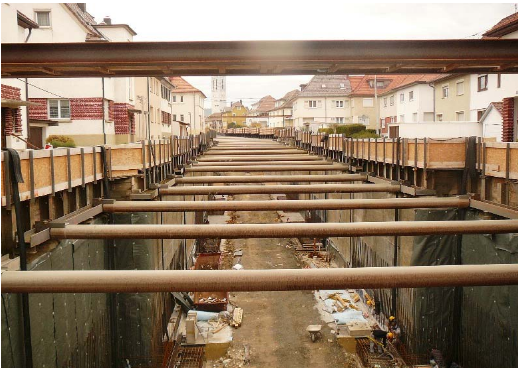
Baugrube November 2008