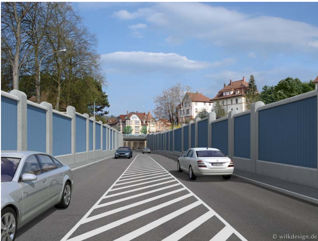
Portal West, Visualisierung