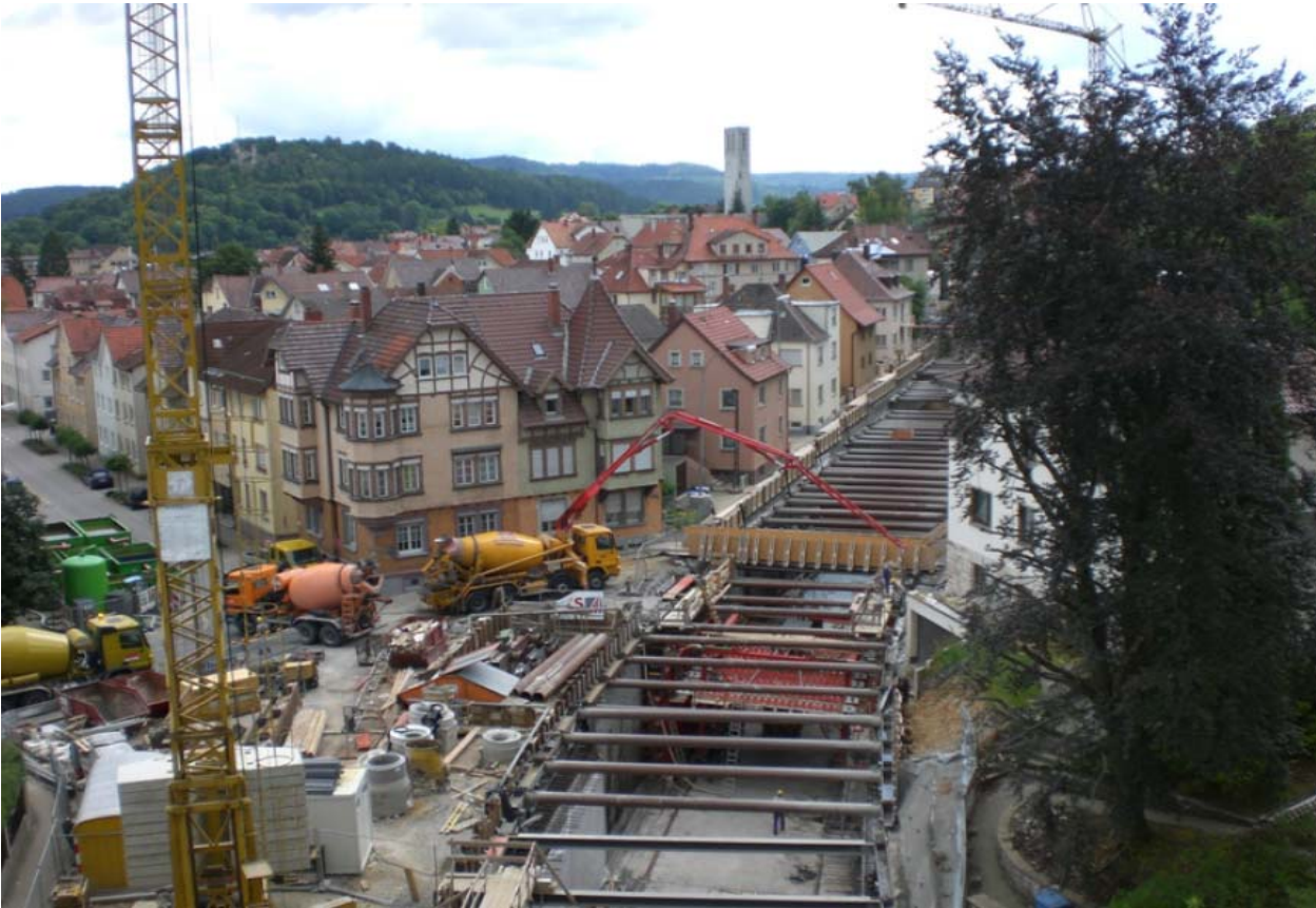
Bauabschnitt 1 Blick vom Kran